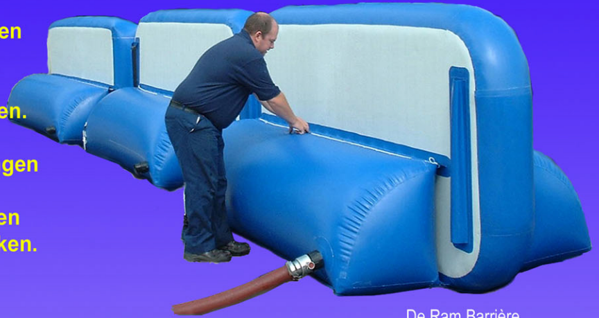
De Ram Barrière

Ze kunnen opgeblazen blijven in omgevingen waar de aanwezigheid van verdachte voorwerpen vermoed wordt, of opgeborgen worden om ze waar en wanneer te gebruiken.