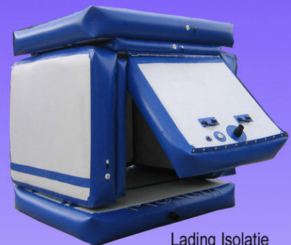
Lading Isolatie Systeem